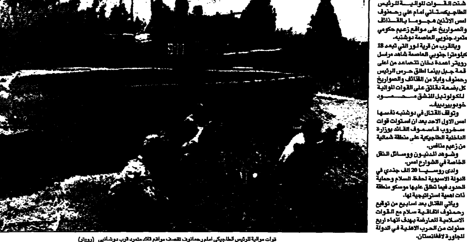
قوات الرئيس الطاجيكي، أمام معسكرات تمسك مواقع قائد متمرد قرب دوشنبه (روسيا)